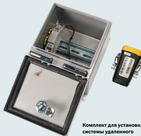
Комплект для установки системы удаленного мониторинга TRUCONNECT®