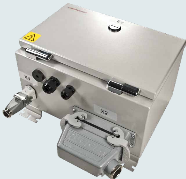
Корпус устройства ControlPro Upgrade