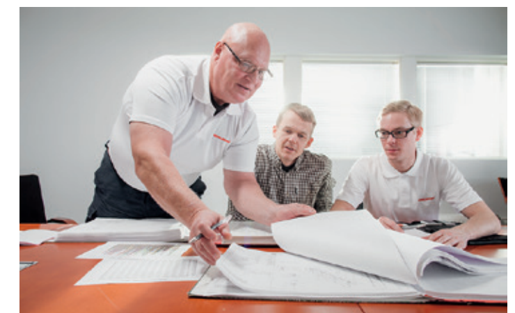
Instandsetzungsempfehlungen und Beratung vor Ort.