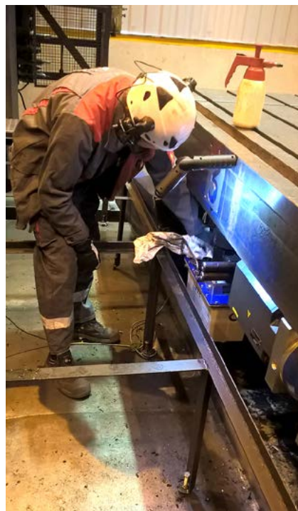
Työturvallisuus ja ammattitaito luovat perustan tehokkaalle kunnossapidolle.

Neuvottelupöytäan otettiin mukaan Konecranes työstökonehuollon edustajat. Esitelty työstökonehuollon huolto-ohjelma COMMITMENT teki vaikutuksen. Konecranes vastaa kyseisessä huolto-ohjelmassa kokonaisvaltaisesti