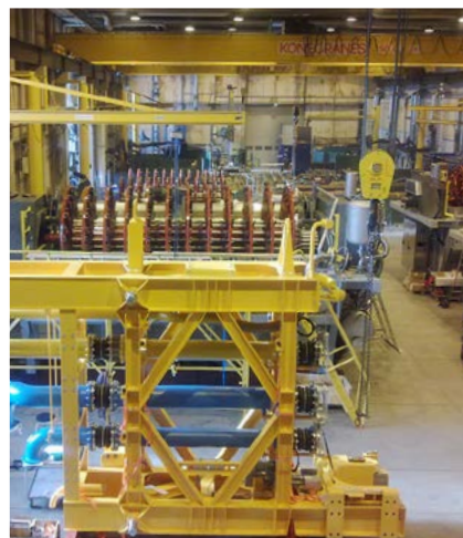
Tehtaan asennusosastolla projektit valmistuvat aikataulussa, ja koeajot ovat alkamassa.