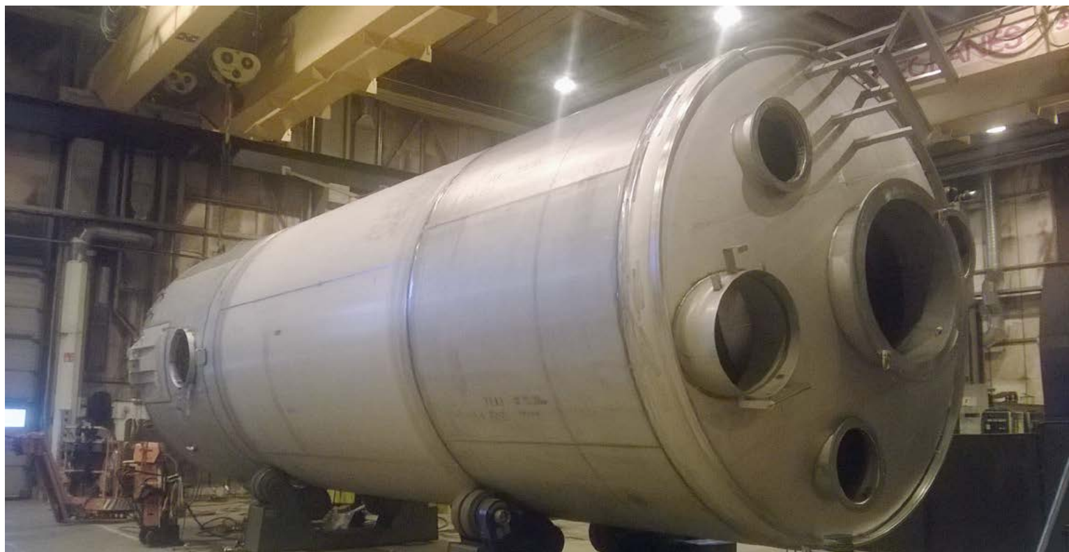
Koneiden ja nostureiden huollon ollessa kunnossa, pääsevät hitsausosaston ammattilaiset näyttämään osaamistaan.